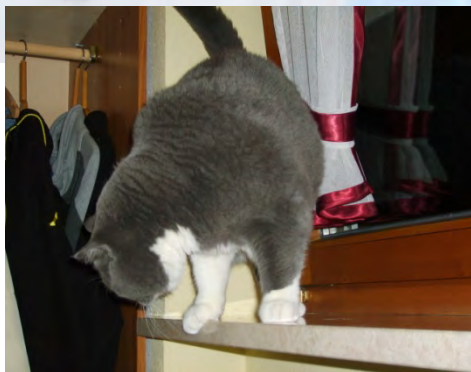
Über die Fensterbank...