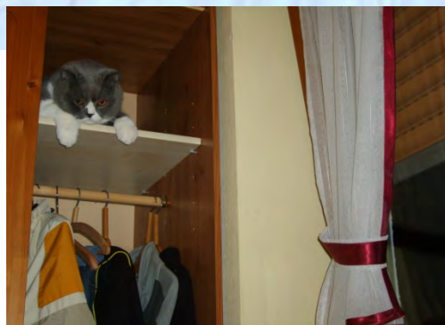
... in den Kleiderschrank