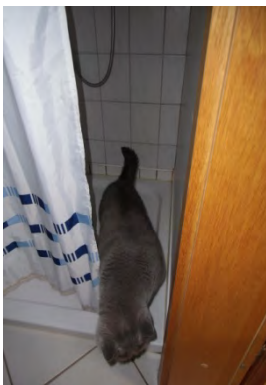
... komm raus du kleiner Zwerg.