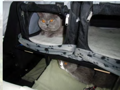
... die andere Möglichkeit.

Wir haben ja bereits in unserem ersten Moselbericht erwähnt, dass unsere Vermieterin sehr tierlieb ist (Was auch immer „Tiere“ sind !! Hihi), ein Beweis hierfür hängt direkt im Hauseingang: