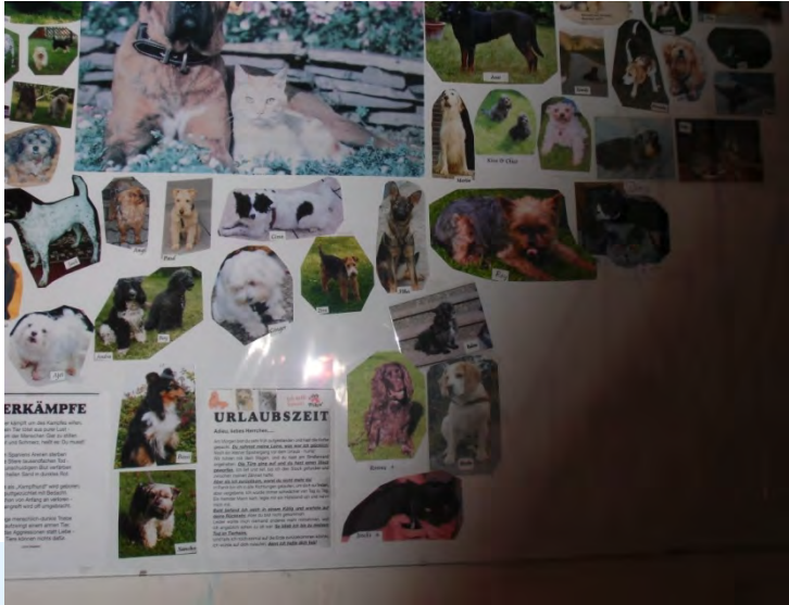
Toll zusammengestellt, oder???

Aber weiter: Also, in der Wohnung angekommen wurde, nach dem Aufstellen unsere Sachen, erst einmal alles von uns in Augenschein genommen. Da wir ja naturbedingt sehr neugierig sind, interessierte uns natürlich auch, was draußen geschah.